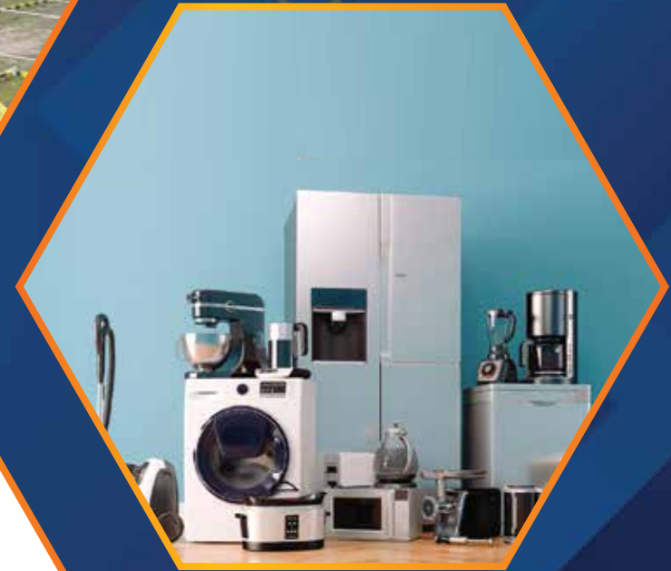
ONLINE HOME APPLIANCES