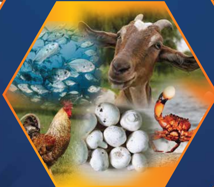
EXPORT OF PROCESSED LIVE STOCKS