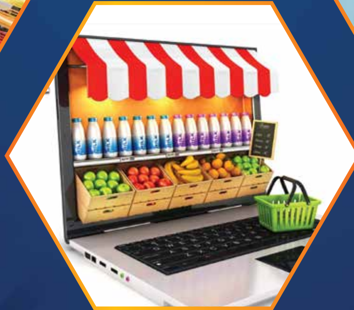
ONLINE GROCERY SHOPPING & SUPERMARKET ( IN INDIA )