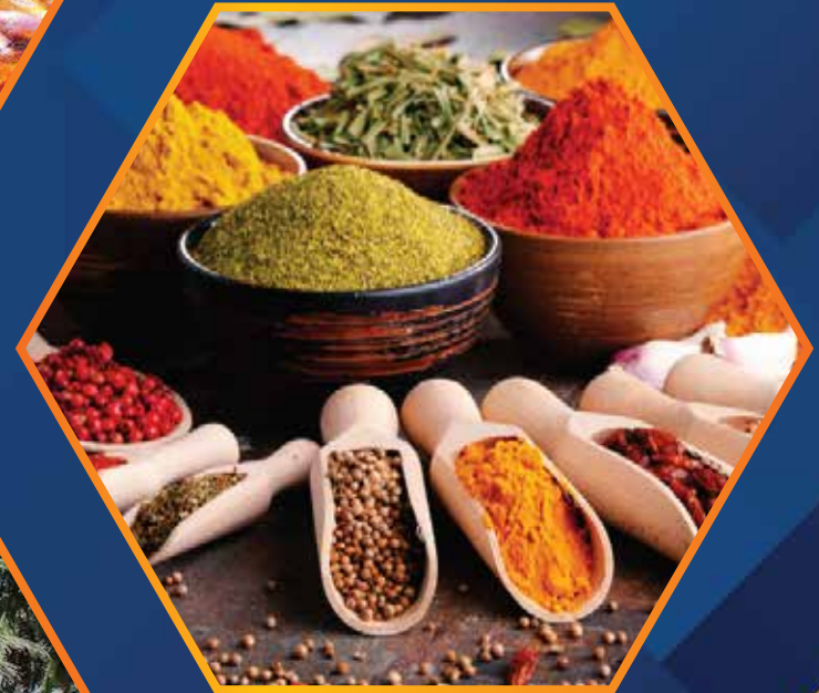
FOOD & SPICES PROCESSING PLANT