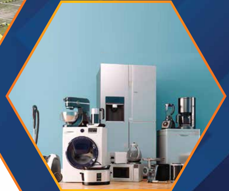
ONLINE HOME APPLIANCES